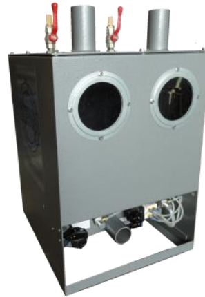
STYROMIX unité de mélange individuel pour STYROMIX 3